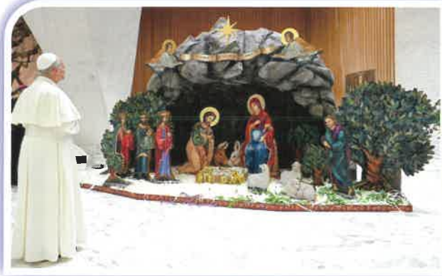
Papa León XIV se detiene a orar en frente del Nacimiento en la Sala de Audiencias Paul VI en el Vaticano el 15 de diciembre, 2025.

“Difundan este mensaje y mantengan viva esta tradición. Son un regalo de luz para nuestro mundo, que necesita deses- peradamente poder seguir teniendo esper-anzas,” dijo él.”