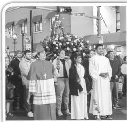
El obispo Tyson encabezó una procesión de la Virgen de Guadalupe en el centro de Yakima.