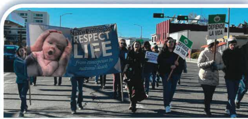
Cientos de personas participaron en la Marcha por la Vida de 2024 en Yakima.

Todos están invitados a unirse al grupo Tri-Cities Students for Life en una manifestación a favor de la vida que se llevará a cabo el sábado 17 de enero a la 1 p.m. Para participar unirse en la banqueta cerca del Holiday Inn en George Washington Way en