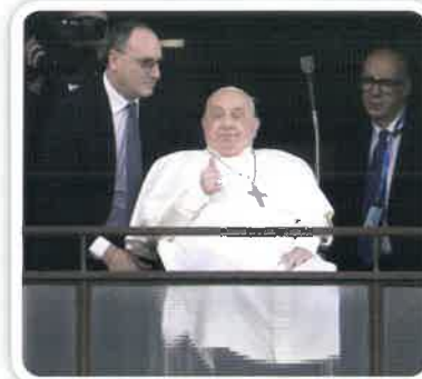
El Papa Francisco saluda con el pulgar hacia arriba a una multitud en el Hospital Gemelli de Roma antes de regresar al Vaticano el 23 de marzo.

Imágenes de televisión del Papa, sentado en el asiento delantero de un Fiat blanco, mostraron que estaba usando oxígeno a