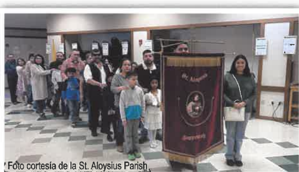
Más de 200 catecúmenos y candidatos de la Parroquia St. Aloysius en Toppenish estaban entre los que fueron recibidos en el Rito de Elección.

El 9 de marzo en la Iglesia Holy Family en Yakima, el Obispo Joseph Tyson dio la bienvenida a más de 500 catecúmenos y candidatos para una completa iniciación cristiana de casi 30 parroquias mediante el Rito de Elección que se celebra anualmente.