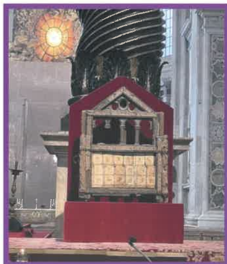
La Cátedra de San Pedro en el 2024 en la Basílica de San Pedro, expuesta por primera vez desde en 1867.