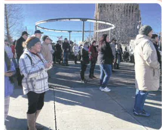
Participantes en la Caminata por la Vida de Yakima se reunieron para orar en la Plaza Milenial.