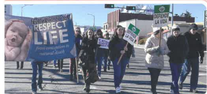
Los Estudiantes Católicos por la Vida de Moxee, Selah y Yakima llevaron la pancarta de la Coalición Pro-Vida, junto con los carteles de Caballeros de Colón y las Hijas Católicas de América el 25 de enero. Caminata de Yakima por la vida.