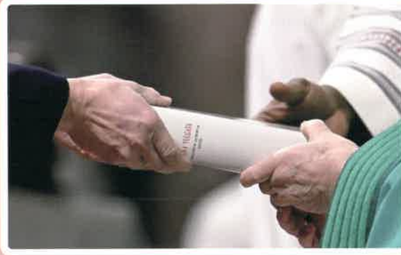
El Papa Francisco entrega una Biblia a uno de los ministros instituidos al ministerio de la lectura durante la Misa que presidió este 26 de enero en la Basílica de San Pedro el Domingo de la Palabra de Dios y último día del Jubileo del Mundo de la Comunicación. El Papa instituyó a 40 hombres y mujeres laicos de 11 países.

En la lectura del Evangelio del día (Lc 4,14-21.) Jesús se revela como el Mesías, dijo el papa. Y las lecturas también revelan las "cinco acciones