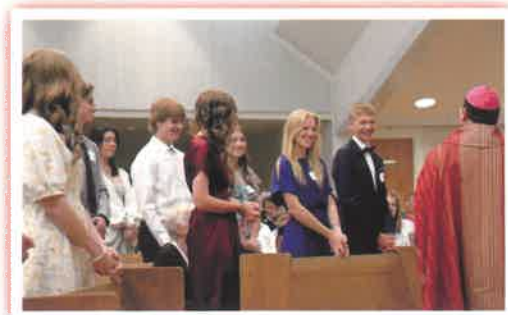
Candidatos a la Confirmación disfrutando un ligero momento con el Obispo Tyson.

La Confirmación completa cías del bautismo. En la Iglesia oriental, el sacramento es adm al mismo tiempo que el bautism. Debido a que la Iglesia occiden reserva la administración de la mación normalmente a los obis es práctico confirmar a todos a del bautismo, y la administrac dos sacramentos con el tiempo separado. Los sacerdotes son d durante la Pascua para bautizar firmar a adultos que han sido p