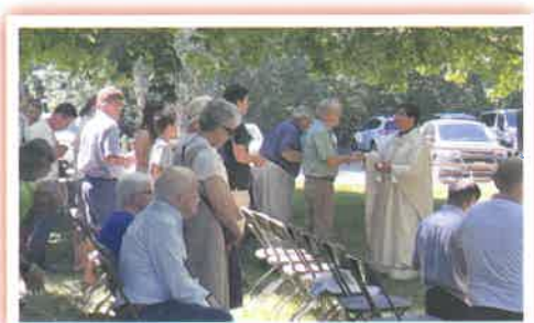
Los comunicantes se presentaron durante la Misa en la Fiesta de la Santa Kateri Tekakwitha.