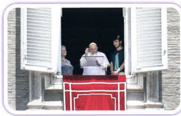
El Papa Francisco se dirigió a la multitud, flanqueado por una abuela y su nieto.

El papa explicó que “esto sucede cuando se pierde el valor de cada uno y las personas se convierten en una carga significativa y luego son juzgados en base a los términos de su costo, en algunos casos demasiado elevada. Lo peor es que, a menudo, los mismos ancianos terminan por