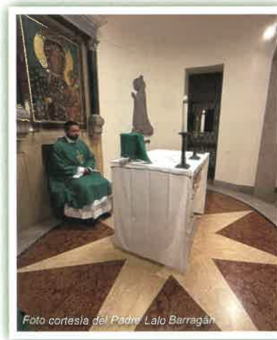
El Padre Barragán celebró Misa en el Capilla de Nuestra Señora de Czestochowa en Basilica de San Pedro.

“El asistir a esta peregrinación con sacerdotes hermanos me dio la oportunidad de apreciar el vínculo que tenemos con otros sacerdotes aquí en la Diócesis de Yakima,” observaba él. “Todos nos conocemos...” Algunos sacerdotes de otras diócesis de EE. UU. le dieron la impresión de que ellos