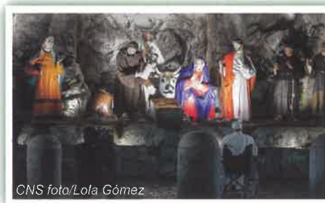
El Papa Francisco visitando el Nacimiento en la Plaza de San Pedro después de dirigir un servicio de oración el 31 de diciembre, 2023, Víspera de Año Nuevo.

En su homilía, el Papa Francisco dijo que el próximo año implicará una ir