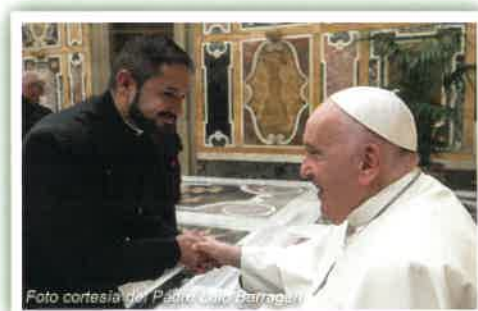
El padre Barragán saludó al Papa Francisco.

Después del servicio de oración, el papa saludó a las personas alineadas a lo largo de la nave central de la basílica. Luego, andando en su silla de ruedas, salió para orar enfrente del Nacimiento en la Plaza de San Pedro, tomándose su tiempo para saludar a los visitantes, bendecir a los niños y escuchar a la banda de la Guardia Suiza mientras tocaba villancicos.