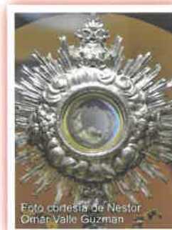
La hostia de Lanciano se hizo de carne, en todo el sentido.

Un monje basiliano, que tenía las mismas dudas que ustedes podrían tener, estaba celebrando la Misa. Después de la Consagración, la hostia se convirtió en carne visible del tejido del corazón y el vino se convirtió en sangre visible, ambos con todas las propiedades de la carne y la sangre humana. Científicos distinguidos fueron llamados a examinar los resultados del milagro y determinaron