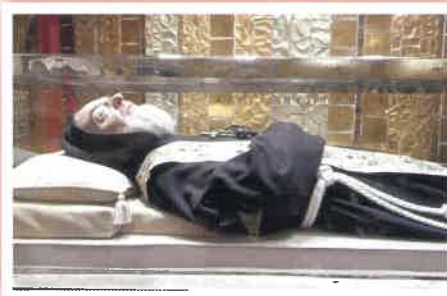
Los restos conservados de San Padre Pío inspiran a muchos.

Que tengan una hermosa Navidad, rica en el mensaje eterno de esperanza y salvación que nos trajo un Bebé en un pesebre, y que todavía está vibrantemente presente para nosotros hoy.